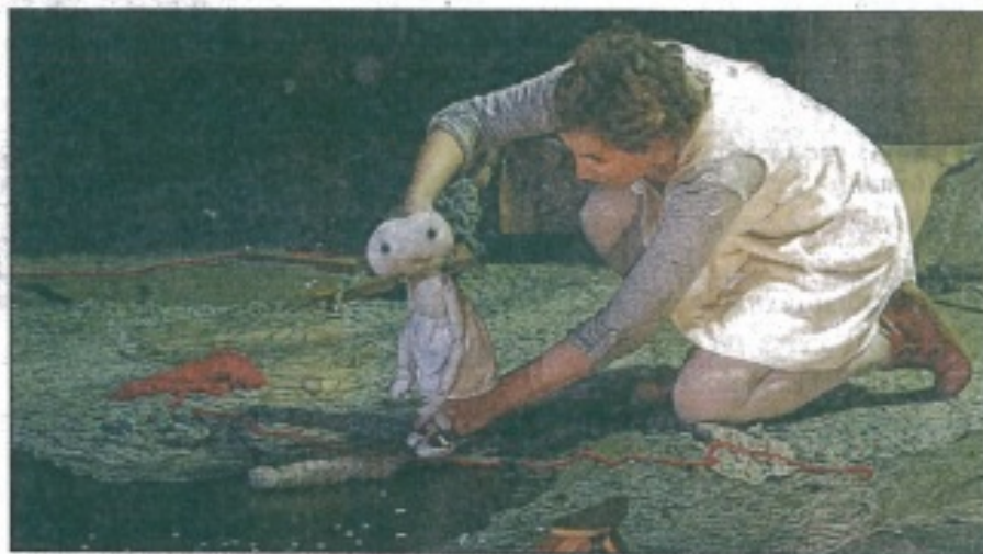
Une bouille à la E.T. l'extra-terrestre, des yeux malicieux et une langue bien pendue. Ce petit bout a parlé aux enfants.

« J'ai pas d'parents », clame le héros. Mais tellement de copains qu'il a trouvés au hasard de l'heure de spectacle, des copains qui ont dénoué avec lui les points d'interrogation. Que de trouvailles dans ce divertissement, à travers des comédiens qui se dédoublent, une bande-son créée en direct et une boule de chiffon si nature qu'elle paraît vraie. Pour les jeunes spectateurs, elle l'était sans doute. ■