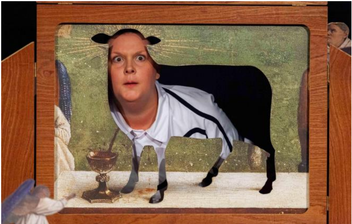
«Lagneau» d'Audrey Dero salué notamment par le Prix de la Ministre de l'Enfance et par le coup de coeur de la presse. - Pierre Exsteen - Province de Liège.